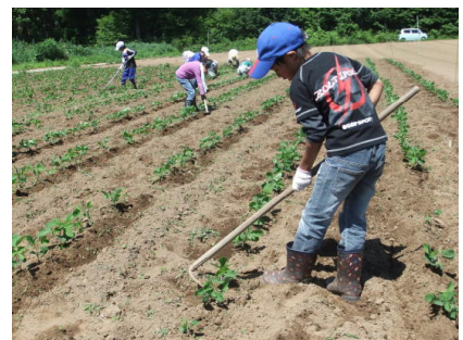
土寄せも様になっています。