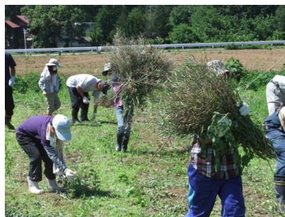
みんなで手分けしてよく動きました。